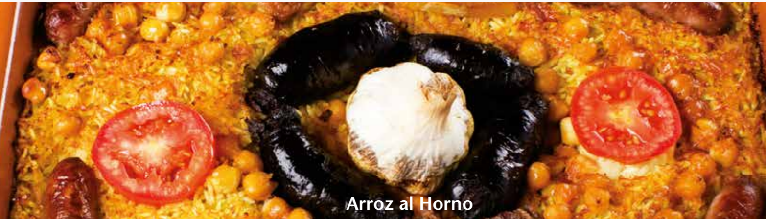
Arroz al Horno

Promociones indicadas durante el año 2017