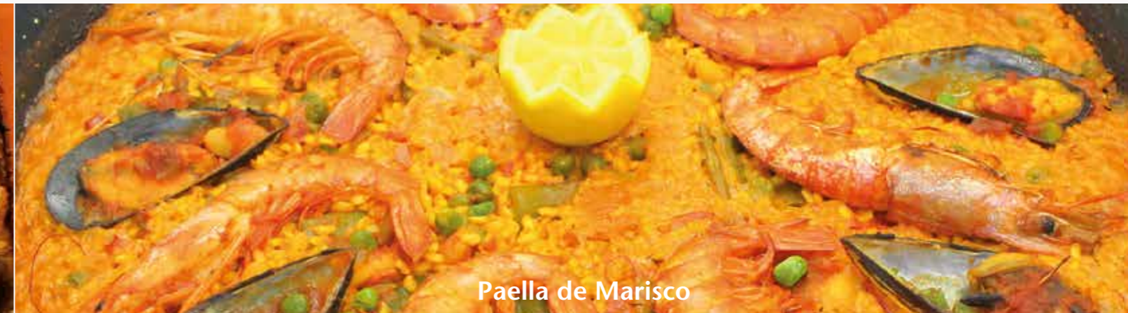
Paella de Marisco